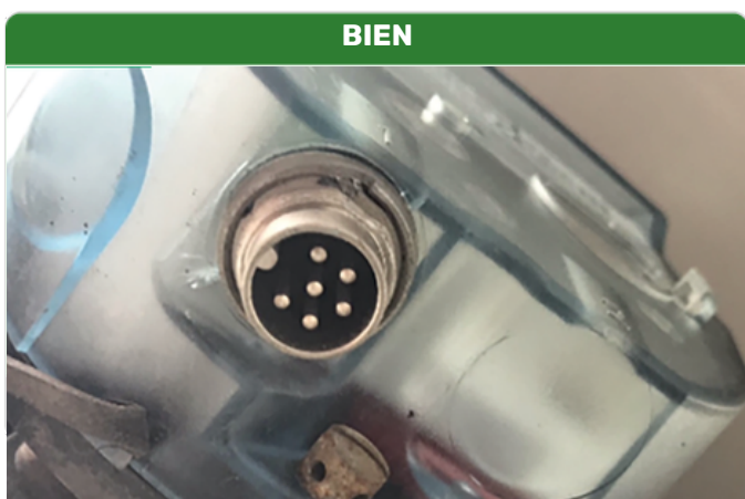
La disposition des broches est clairement visible et nette