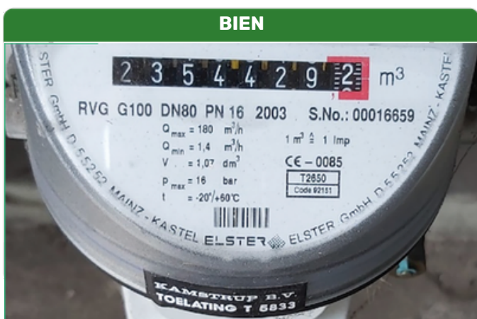
Le texte est net, parfaitement lisible et ne produit aucun reflet